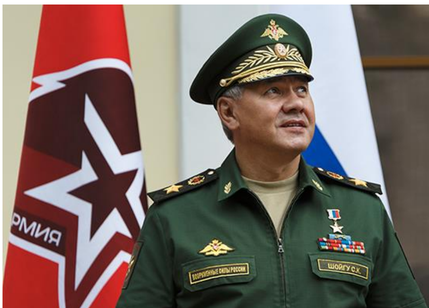
Герой Российской Федерации, Министр обороны Российской Федерации, генерал армии Шойгу Сергей Кужугетович